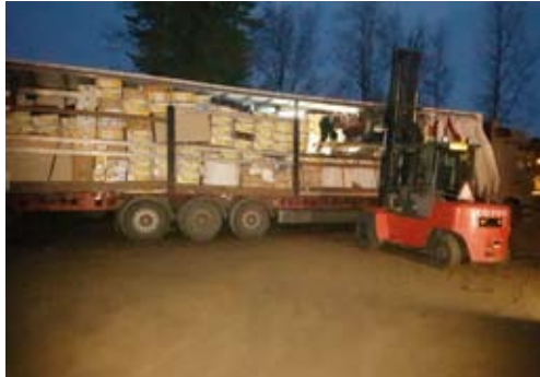
Trukki käsien jatkeena