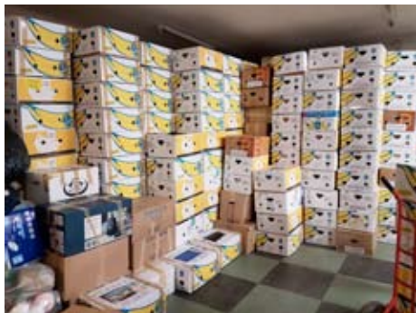
Asarian varastolla laatikot valmiina lähtöön