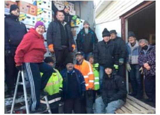
Rekka saatiin lastatuksi

Tulethan mukaan! Saat paljon käytännöllistä tietoa avustamisesta!