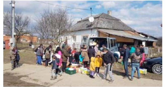
Avustus meni perille