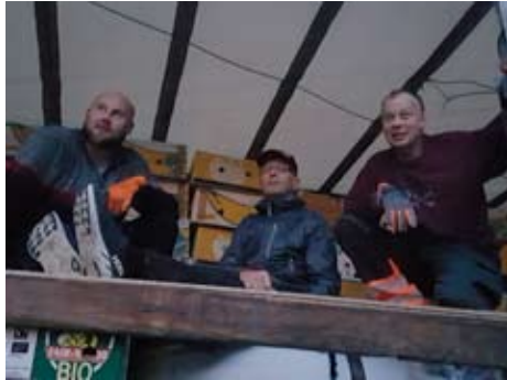
Avustusrekan lastaus voiton puolella