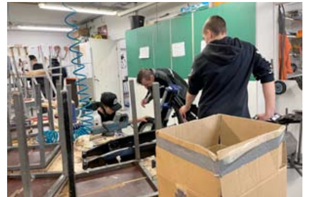
Poikien mielestä tämä on mukavaa touhua. Yläkoulun metallityön luokassa ovat hyvät tilat.