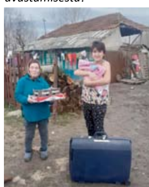
Matkalaukku toimii äitiyspakkauksena