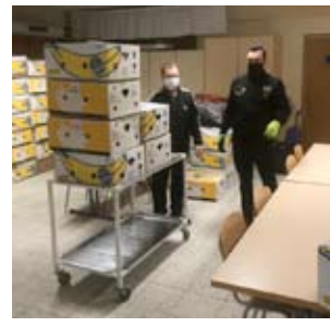
Alavuden eka kuorma lähti maaliskuussa-21