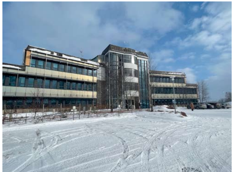
Suurin osa kaupungin toimistoista on Fasadissa ja moneen pisteeseen eri puolille kaupunkia sijoitettuna.

Tärkeä voimavara koko kaupungin kannalta on se, että päätöksenteossa pystytään edistämään Alavudelle tärkeitä yhteisiä tavoitteita ja hankkeita niin yritysten kuin asukkaiden hyväksi.