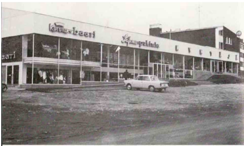
Uusi tavaratalo avattiin 7.12. 1962.