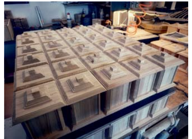
Omassa verstaassa tuhkaurnia valmistusprosessissa