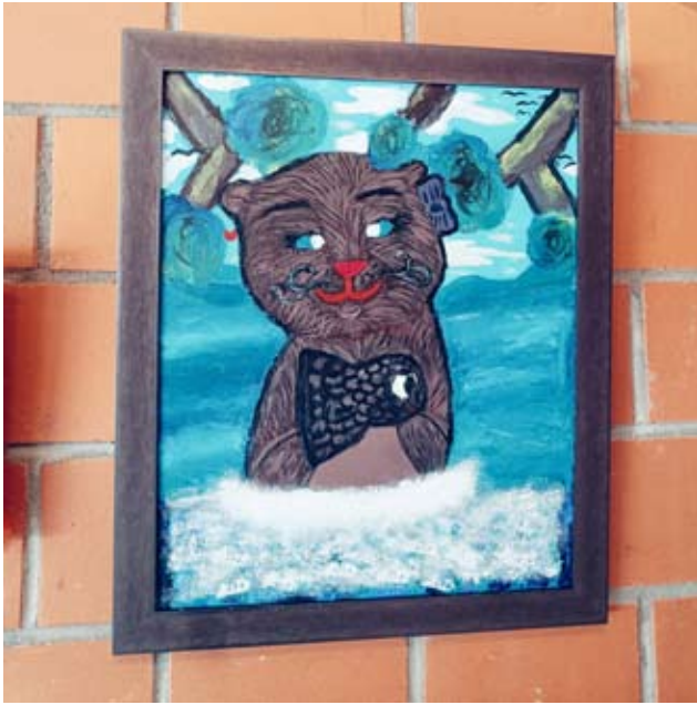
Lakeudenportin kansalaisopiston kuvataidekoululaisten yhdessä toteutettu ryhmätyö. Jokaisen oppilaan kädenjälki on tässä esillä olevassa isoimmassa työssä tärkeä.

Pirkanpohjan Taidekeskuksen punaisessa talossa vietettiin keskiviikkona 12.4 lasten toimintapisteen avajaisia. Pirkanpohjaa on kehitetty lapsiystävällisempään ja huomioivampaan suuntaan. Lakeudenportin kansalaisopiston Ähtärin kuvataidekoululaiset tuusivat lasten toimintapisteeseen puuhapöydän sekä kesänäyttelyiden avauduttua käyttöön toimintakassit joissa on erilaisia tehtäviä maskottisaukon kanssa yhdessä ratkottavaksi. Lapsille toteutetun toimintapisteen on tarkoitus auttaa myös vanhempia keskittymään rauhasa kesän taidenäyttelyihin.