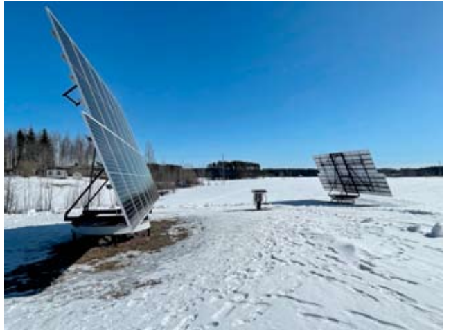
Pellolle ei oikein keksitty käyttöä, joten peltopalalle laitettiin kaksi aurinkovoimalaa.

energiaa. Tässäkin ollaan viisaampia juhannuksena.