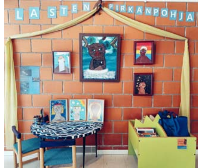
Pirkanpohjan Taidekeskuksen punaisentalon lasten toimintapiste.