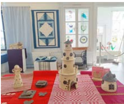
Lakeudenportin kansalaisopiston kevätnäyttely 2023