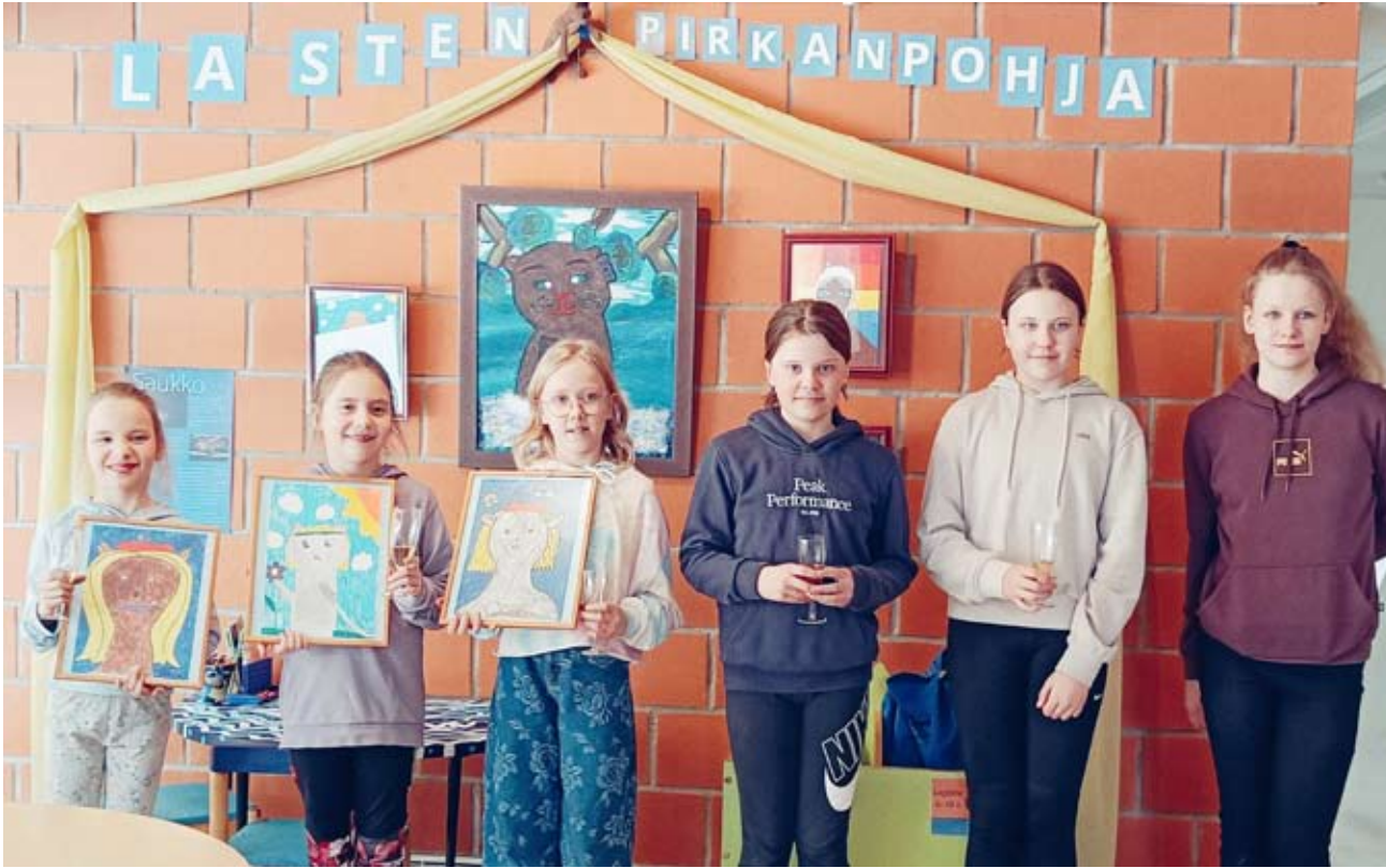
Osa kuvataideryhmän taitelijoista toteutetun lasten toimintapisteen avajaisissa.