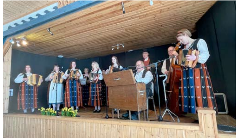
Alavuden Kaksiriviset ovat tässä Kevättä palkeissa-tapahtumassa, mutta soittajia nähdään myös Lokakuun Loiskeissa, nyt Seinäjoella.

Idyllinen Hotelli Sorsapesä on hyvää vauhtia profiloitu- massa tapahtumahotelliksi ja omaa pitkät perinteet, niin maakunnan väen kuin matkailijoidenkin suosikki- kohteena.