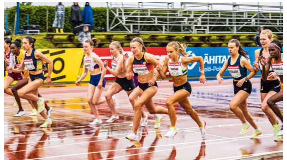
Kuortane Games käytiin viime kesänä kosteissa olosuhteissa. Nyt toivotaan hyviä kesäkeljiä lauantaisiksi 17.6.

Ennakkoliput tarjoaa Live-to: https://events.liveto.io/events/world-athletics-continental-tour-silver-84-kuortane-games-2023