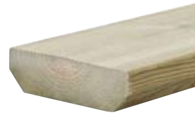
KESTOPUU TERASSILAUTA 28X95 VIHREÄ