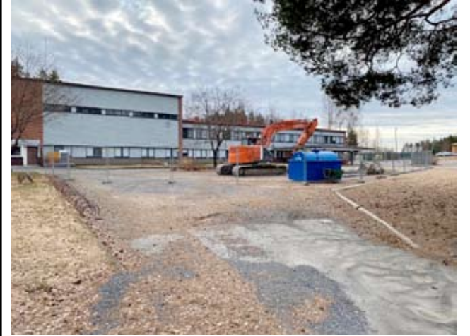
Entisen Alvarin purkutyöt ovat parhailaan käynnissä, vaikka vielä kuvassa rakennus seisoo ehjänä paikallaan.

Parhailaan alueelle laaditaan pihasuunnitelmaa.