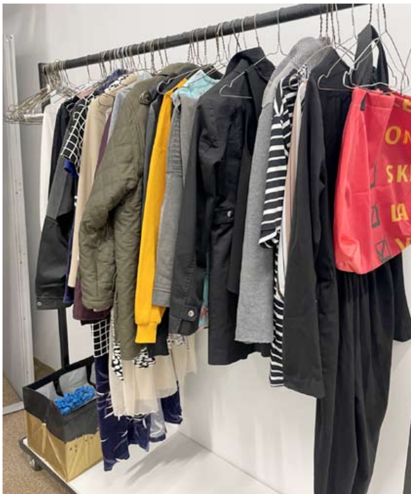
Tässä on henkareilla kierrätykseen tulleita hyviä vaatteita, jotka ovat menossa tuunaukseen

Textuuri on avoinna aamukahdeksasta puoli neljään iltapäivällä. Paikka on tullut tarpeeseen ja hankkeen päätyttyä, sen toivotaan olevan pysyvää toimintaa. Textuuri ei kilpaile kenenkään kanssa, eikä pyri saamaan voittoa. Kun saa vaatteensa kierrätykseen, siitä saa hyvän mielen.