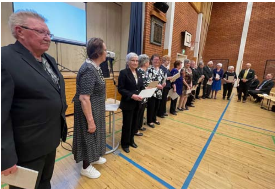
Tässä kultaisen ansiomerkkien saajat, joita oli yhteensä 15.

Lopuksi oli kahvit, jossa leivosten päällä oli numero 50.