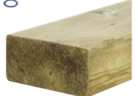
KESTOPUU 48X98 VIHREÄ