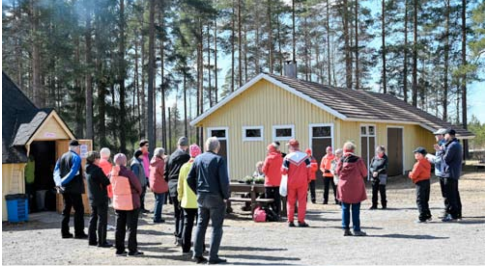
Tässä odotellaan arpajaisten palkintojenjakoa.

Ähtärinjärven Sydänyhdistys otti varaslähdön sydänviikkoon 6.5. Alastaipaleen kylätalolla. "Liikkuen hyvää sydämelle"-teemalla ulkoilutapahtumaan saapui kutsuttuina vieraita Alavuden ja Virtain sydänyhdistyksistä.