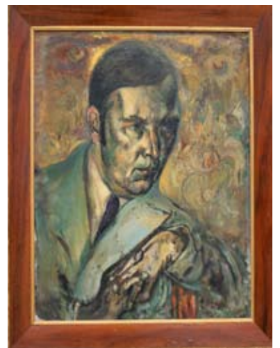
Tässä on vuonna 1943 kuolleen Myntin omakuva.