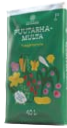
MULTASORMI PUUTARHAMULTA 40L