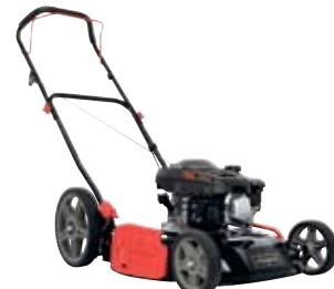
RUOHONLEIKKURI SCHEPPACH MMP150-51