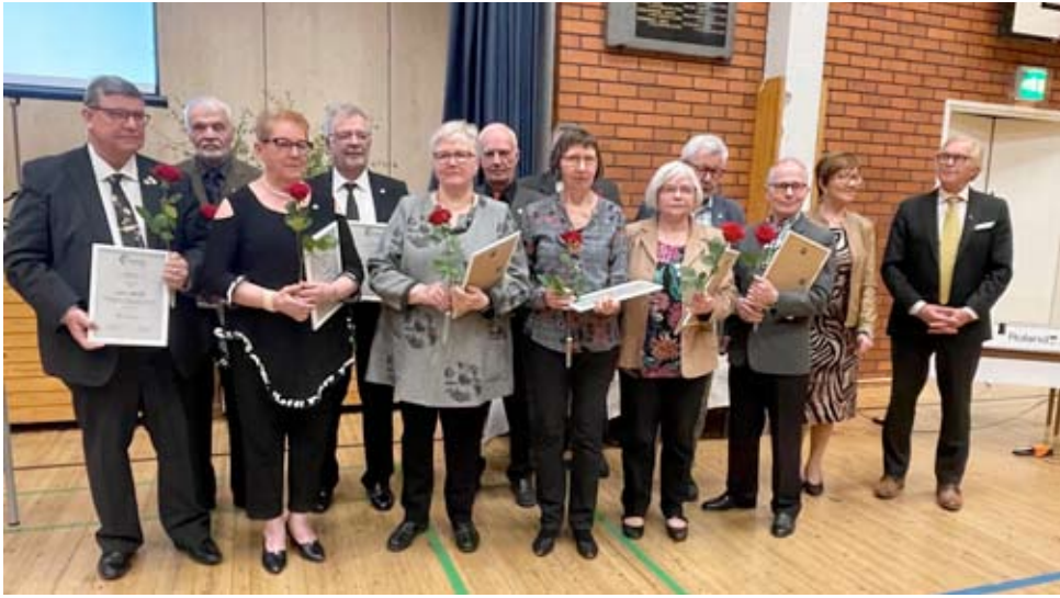
Hopeisen ansiomerkkien saajat asettautuivat riviin. Heitä oli 12.