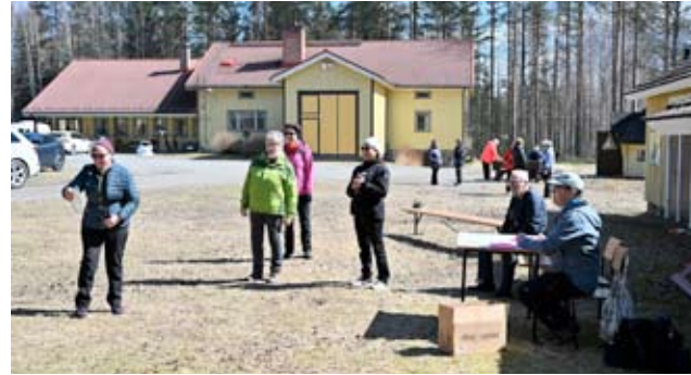
Tässä oltiin puttikisassa. Ähtärinjärven Sydänyhdistyksen päivää oli aurinkoinen ja houkutteli väen ulos.

Mukava yhteinen liikuntailtapäivä kului myös seurustellen ja kuulumisia vaihtaen.