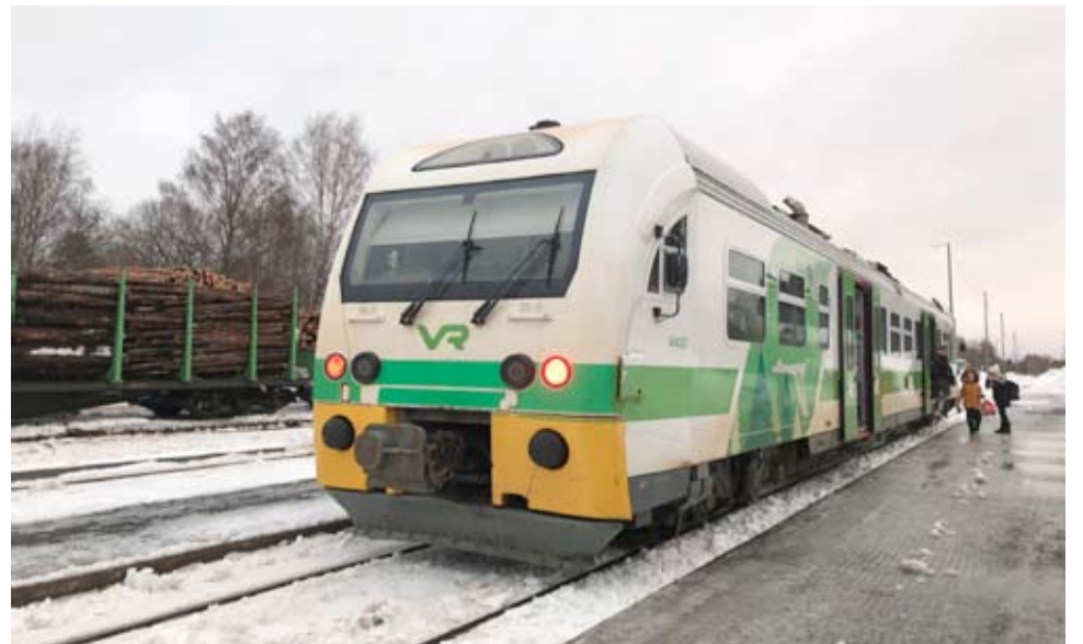
Vaasa–Seinäjäki–Jyväskylä-liikennekäytävän kehittämisryhmä vaatii, että kiskobussiliikenne on turvattava, kunnes rata on sähköistetty.

Ryhmä edellyttää, että tuleva hankintamalli tulee toteuttaa siten, että Seinäjoen ja Jyväskylän välinen raide-liikenne säilyy myös 2030-luvulla sekä siitä eteenpäin, ja sitä voidaan jatkossa kehittää. Erityinen ratkaistava