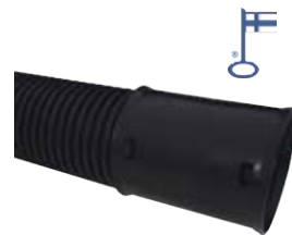
RUMPUPUTKI 110/92X6200 SN8

NORM. 3,19 PHL, A-luokka. 30 päivän alin hinta 3,19 €.