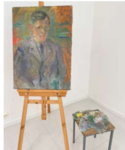
Tämä keskeneräiseksi jäänyt työ on akateemikko Alvar Aalosta.