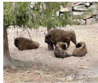
Tässä nelikossa ovat visenttilehmet Myy ja Mymmeli sekä heidän jälkeläisensä Ujo ja Urpo, jotka ovat syntyneet samana päivänä.

Visentti on elävä esimerkki lajin suojelutyön tuloksista. Se on päässyt sukupuuton partaalta virkoamaan nimenomaan eläintarhojen avulla. Visenttin elinalueet kutistuvat voimakkaasti ihmisen leviämisen, metsästyksen ja metsien häviämisen takia. Viimeinen luonnonvarainen visentti kuoli vuonna 1927. Eläintarhoissa oli kuitenkin