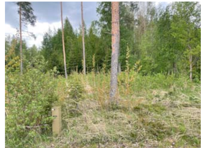
Haankulman kotitontti on nyt metsäinen. Rakennuksia tontilla ei enää ole.