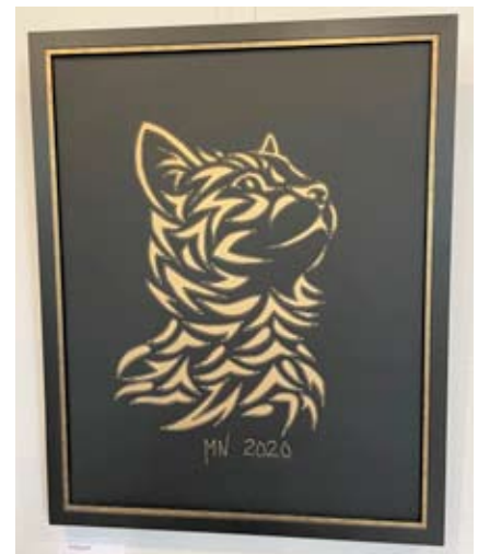
Tämä on aliekompeleilla nahasta toteutettu työ.