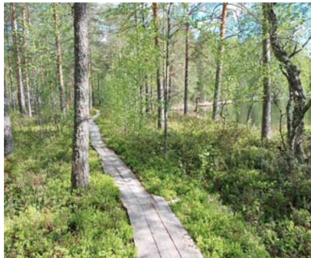
Kierinniemen luontopolulla Ähtärissä on lapsiperheille suunnattu kahden kilometrin mittainen Mysteeripolku, jossa on toiminnallisia tehtävärasteja.

kunta- ja nuorisopalvelut, Ähtärin Eräveikot ry, SPR Ähtärin osasto /ystäväpalvelu sekä Suomenselän Invalidit ry