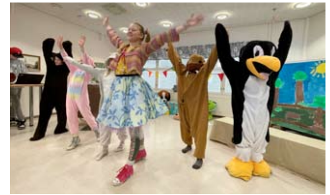
Iloisissa tanssillisissa tunnelmissa alkaa Myllymäen koulun Hertta-näytelmä, jossa Hertta laulaa ja tanssii pehmokave-reidensa kanssa.