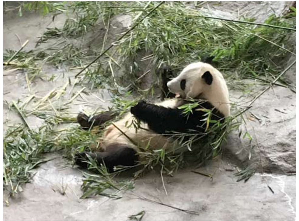
Ähtärin eläinpuistoyhtiölle oli kaupunginvaltuustossa tärkeä päätös lyhytaikaisten lainojen muuttamisesta pääomalainoiksi. Kun yhtiön talous saadaan plussalle, voidaan neuvotella valtion kanssa avustuksesta. Tämä liittyy pandojen pitämiseen Ähtärissä.

Keskustan valtuustoryhmä jätti aloitteen, jossa esitetään, että Ähtärin kaupungin koulukyütejä koskeva petoeläinohjeistus päivitetään strategiassa päätettyä linjausta vastaavaksi. Turvallisen koulutien turvaaminen on prioriteetti jokaisen ähtäriläisen kohdalla asuinpaikasta riippumatta.