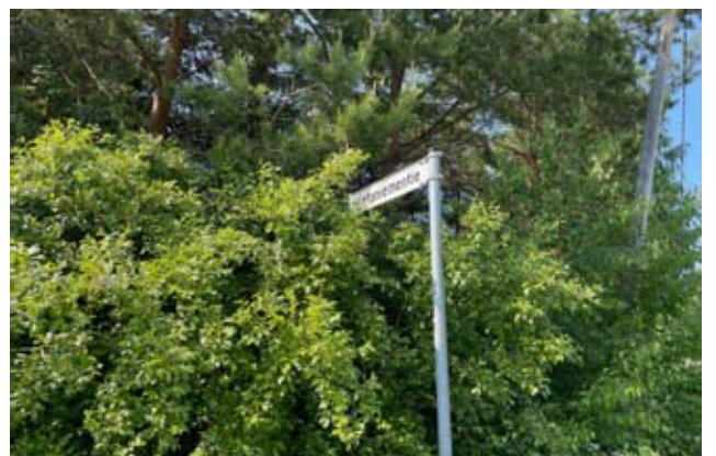
Vähän puskiensa peitossa oleva Sysilammentielle erkautuva Hietaniementien kyltti, joka voi johtaa jatkossa uudelle Puutarhakylän alueelle.

Kunnanvaltuusto hyväksyi viime vuoden tilinpäätök- sen, joka näytti 1,7 miljoonaa euroa ylijäämää. Viime vuoden hyvään tulokseen vaikuttavat valtion maksa- malla puolella ja rajoittuu sekä ennakoitua paremmin kertyneet verotulot.