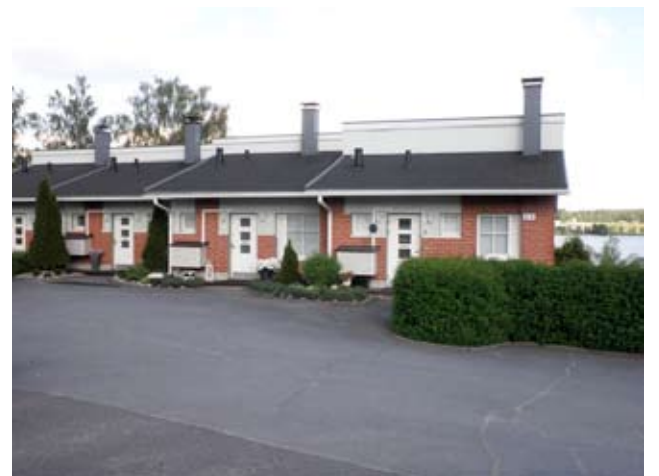
As Oy Lempinlukaali oli yksi Alavuden rivitaloista, joihin otettiin ElmoNetin valokuitu, eikä sitä ole tarvinnut katua. Asukkaat ovat tyytyväisiä nopeisiin yhteyksiinsä.

ElmoNetin valokuidun yhteydessä taloyhtiöön otettiin kaapelit, joka ei ollut kovin kallis lisä kuukausimaksuun ja muutoinkin valokuidun kuukausimaksu on suhteellisen edullinen. Enää televisio ei katko. Valokuidusta As Oy Lempinlukaalissa on silkkaa hyvää sanottavaa.