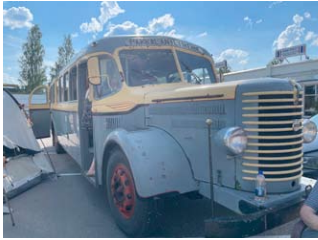
Moni nousi Pakkalan vanhaan linja-autoon. Auto on yhä ajokunnossa.