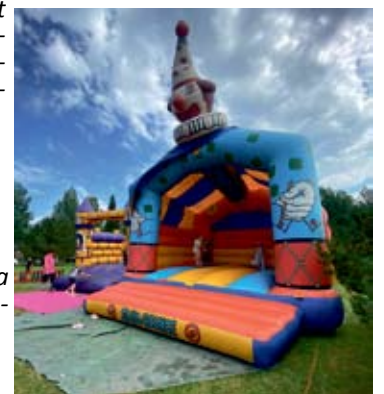
Lapsille pomppivaa hauskuutta pomppulinnoista

Alavus Ryskööt ovat Alavuden yrittäjien järjestämä markkinapahtuma, jota on järjestetty jo yli 30 vuotta.