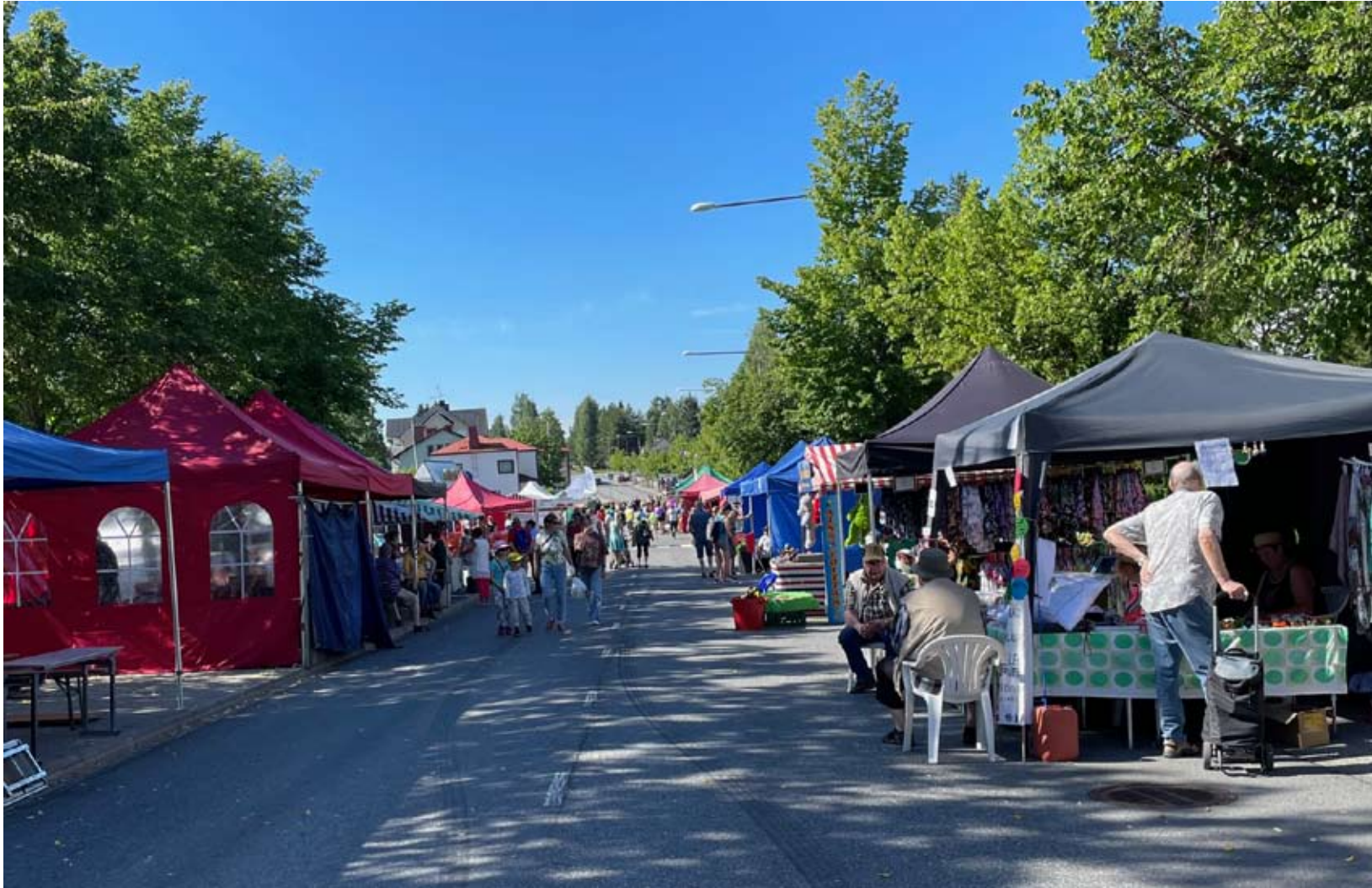
Tästä markkinaväki vain kasvoi päivän edetessä Alavus Rysköillä, joissa oli todella helteisen kuumaa.