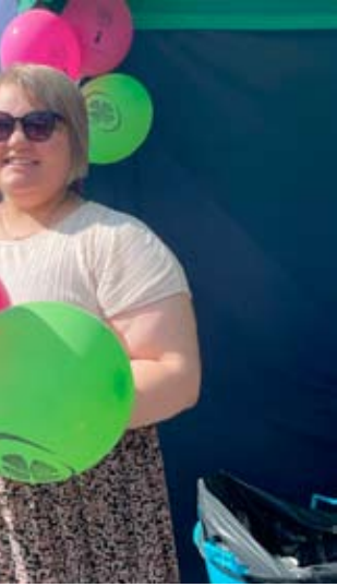
eskustan teltalla ilmapalloja.