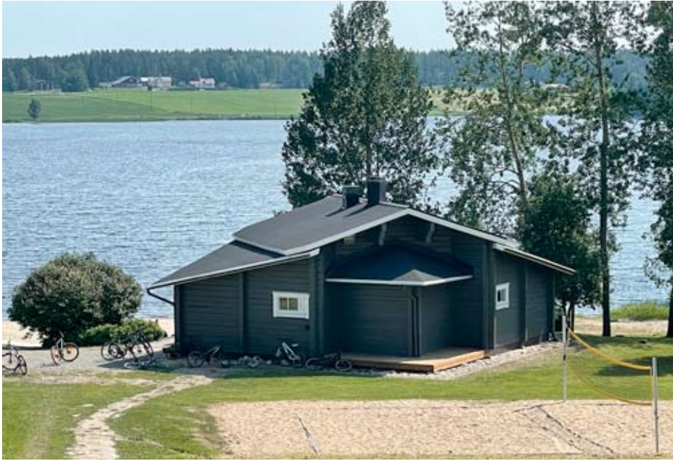
Harrin uimarannan rakennus taidekeskuksen alapuolella on kokenut täydellisen remontin, vaikka rakennuksen raamit ovat sinänsä vanhat.

Harrin uimarannan sauna-rakennus on kokenut täyden uudistuksen. Nyt siellä on ilo käydä suihkussa ja keskiviikkoisin saunassa. Hirsinen rakennus on sinänsä vanha, mutta sitä ei huomaa, sillä myös ulkopinta on saanut uuden maalikerroksen. Harrin uimaranta on näillä helteillä vilkas paikka, ja myös saunarakennus on kovassa käytössä. Nyt toivotaan, ettei tiloissa tehtäisi ilkeäjä.