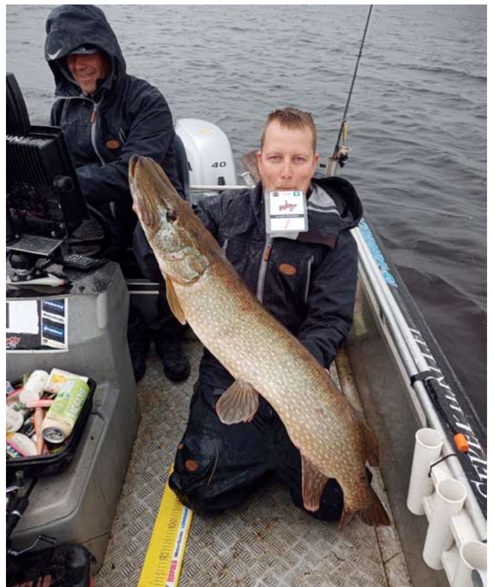
Kisoissa saattaa nousta melkoisia vonkaleita kuten tässäkin.

Voit lukea myös tästä tapahtumasta lisää www.jigicup.com