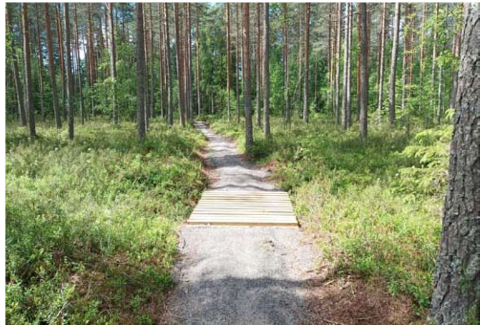
Väliveden reittiä on osittain sorastettu. Toki haastaviakin paikkoja reitiltä löytyy.