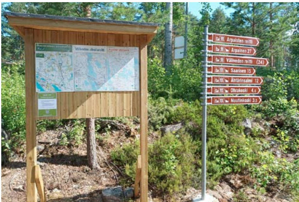
Arpaisten ja Väliveden reittien lähtöpaikka sijaitsee matkailunmäellä tenniskentän vieressä.

Reiteistä löytyy lisätietoa visitahtari-sivustolta. Sivustolle tulee esille karttoja tulostettaviksi sekä sähköiset kartat saa outdooractive-sovelluksen kautta.