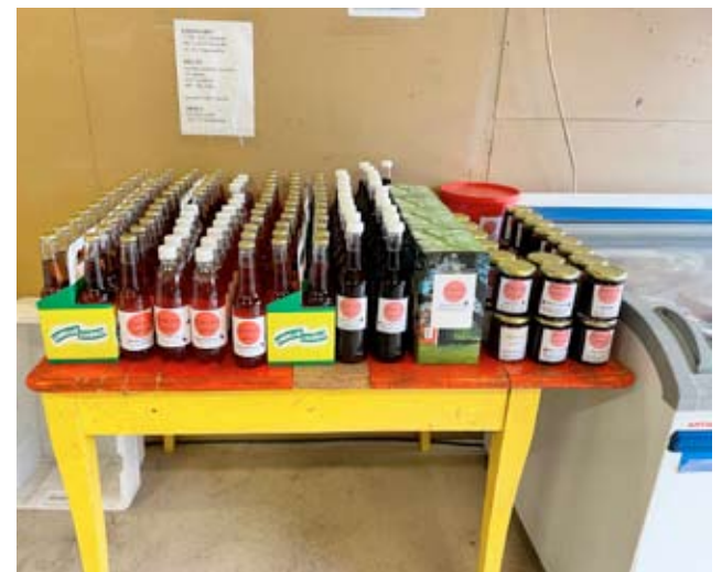
Tilamyymälässä on kaupan paljon muitakin kuin mansikoita, muun muassa mansikkahilloa ja -limonadia sekä mansikkamehua.

Joukko pehmoisia lampaantaljoja on yhdellä orrella. Niitä menee kesällä, mutta erityisesti joulun aikaan.