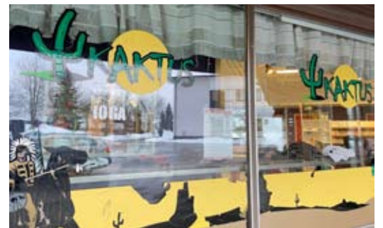
Kaktuksen tilat ovat Töysän liikekiinteistössä. Ulkoteippauksista ne on helppo löytää.