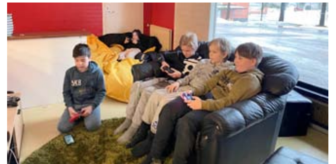
Kaktuksessa on monenlaisia pelejä. Pojat pelailivat PlayStationia.