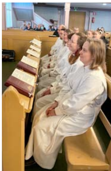
Kuusi Alavuden seurakunnan työntekijää siunattiin tehtäviinsä sunnuntaina Töysän kirkossa, jossa he istuivat eturivissä ennen siunaamista

Kirkkoherran vaali on koittamassa loppuväestä. Tätä ennen tuomiokapituli haastattelee hakijat ja ohjeistaa valintaa.