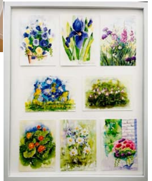
Tässä on kahdeksasta eri kukka-aiheesta kerätty korttikollaasi.