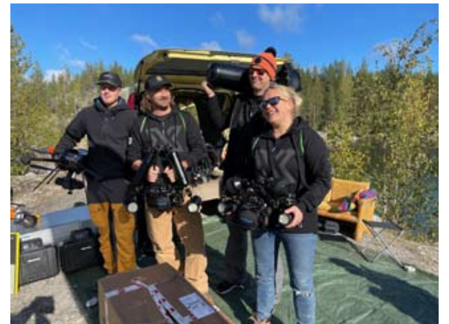
Bottomline Projectsin väki asettui yhteiseen kuvaan, kun he ensimmäisen kerran esittelivät väliseistöään louhoksella, jossa eri kojeista. 3D-mallinnuksesta kerrotaan tulevanakin lauantaina.