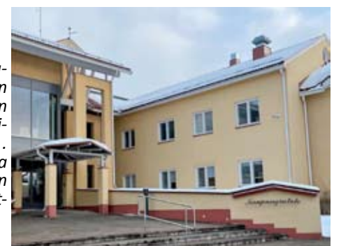
Ähtärin kaupungintalon ovet pidetään lukittuina toimisto-aikaan. Pääovesta pääsee sisään ovikelloa soittamalla.

Lisäksi Ähtärin kaupungilla on elokuun alusta ollut käytössä hybridityömalli, joka mahdollistaa osittaisen etätyön. Sopimalla tapaamisesta ennakkoon asiakkaat välttävät turhilta käynneiltä, kun viranhaltijat ovat paikalla kaupungintalolla, eivätkä esimerkiksi etätyössä tai kokouksessa.