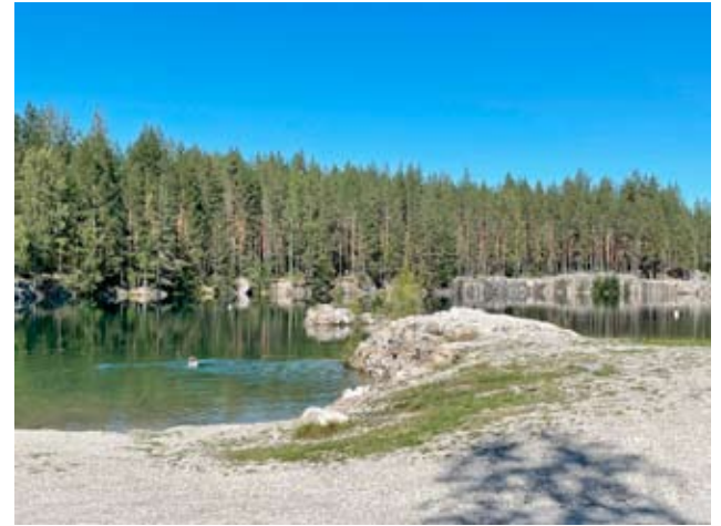
Kaatialassa on kirkas vesi, joten se on myös suosittu uima- paikka. Aurinkoisena päivänä siellä oli nytkin uijia.

Louhoksissa on kalojakin: särkiä, ahvenia ja haukia. Toivetta on ollut, että louhokseen saataisiin uimaan joitakin jalokaloja, joita voisi kuvata kirkkaassa vedessä.