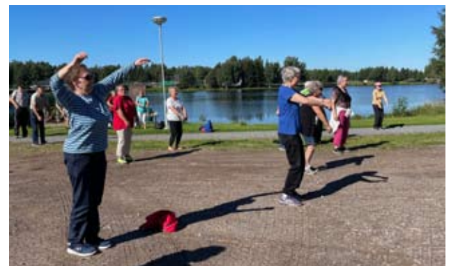
Kaupungin liikunnanohjaajat vetivät kevyen pihajumppan, jossa nosteltiin käsivarsia ja jalkoja.

Sopiva kävelykierros oli Vähäjärven ympäri. Usea kävi reippaasti kävelemässä. Mukavasti liikuntapäivässä kului parituntinen.