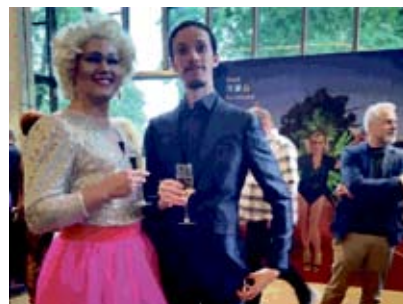
Upeita drag tähtiä yleisössä sekä lavalla ensi-iltana