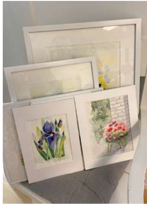
Keittiön tuolilla on pari kukka-aihetta, mutta myös muita tauluja.

Mahdollisesti hän pitää joskus tulevaisuudessakin näyttelyn, jossa luonnollisesti on myös kukkatauluja.