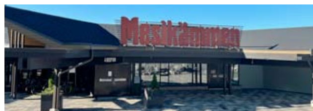
Ähtäri Zoo ja Hotelli Mesikämmen aikovat tasapainottaa talustilannettaan.

- Tavoitteena on valmistautua sesongin jälkeen tulevaan talveen, koska tiedämme tulevien kuukausien kustannustason nousun. Kuten monessa muussakin kotimaan matkailukohteessa, tänä vuonna ei tulla tavoittamaan viime vuoden asiakasmääriä, kertoo Väliaho