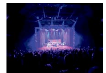
Täysi katsomo, ensi-ilta Priscilla- Aavikon kuningatar