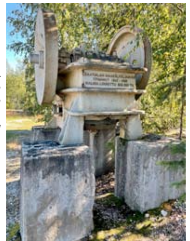
Tässä koneessa kerrotaan, että Kaatialan maasälpälouhos on toiminut 1942-1968. Malmia on louhittu 556 800 tonnia.