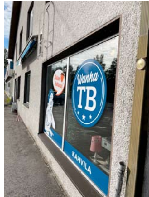
Wanhalla TB pysyy paikan nimenä, joka näkyy ulkoteippauksissa. Monet tulevat yhä kahville Luhtasaarelle, jolla nimellä rakennus vieläkin tunnetaan.