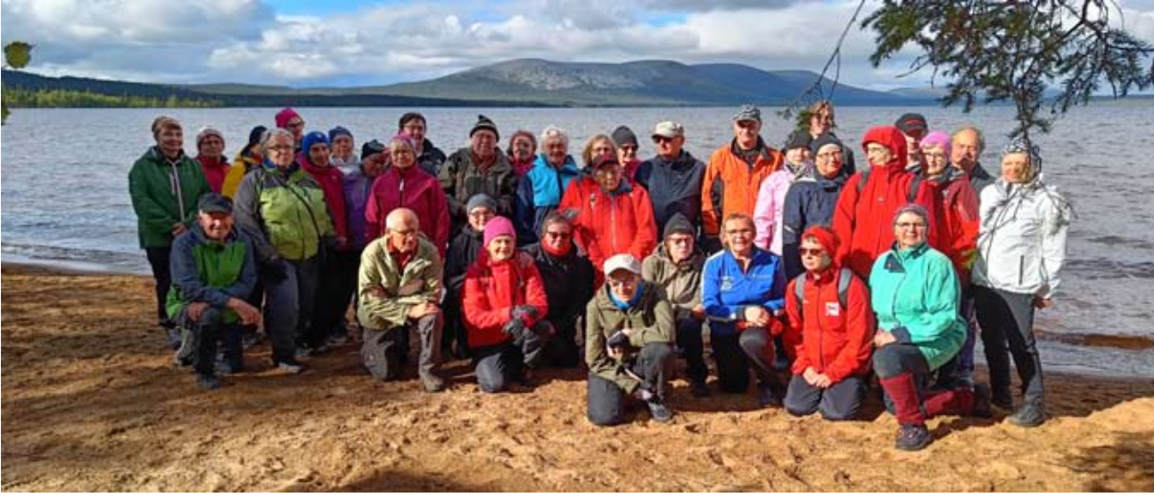
Kuvat Mari Järvinen: yhteiskuva Punaisella hiekalla, Pallastunturi taustalla.

Tule kanssani, herra Jeesus tule, siunaa päivän työ. Tule illoin ja aamuin varhain, tule vielä, kun joutuu yö, tule vielä, kun joutuu yö. Näillä virren sanoilla päätettiin yhteiset iltahetket Ruskaretkellä 29.08 – 03.09.2022.