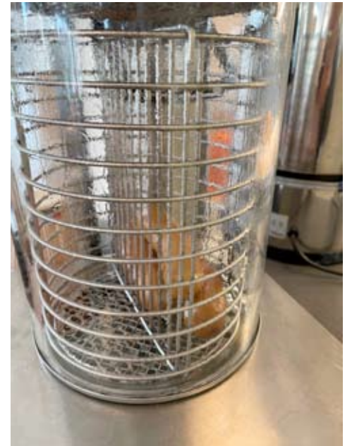
Höyrymakkarat ovat yksi suosikki, jota ohikulkijat käyvät kahvilassa pieneksi suolalaksiksi syömässä. Tarjolla on myös täytettyjä ruisleipiä ja sämpylöitä.

paikka, jossa ihmisiä kohtaa. Asiakaspalveluna hän koki lähihoitajan työssäänkin.