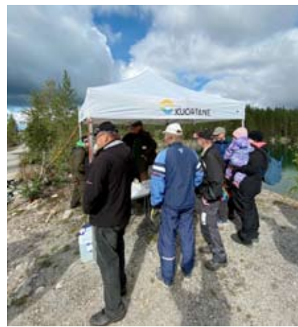
Kaatialan luonto- ja mineraalipäivässä tunnistettiin kiviä Kuortaneen kunnan teltalla.

Bottomline Projectsin sukeltajat olivat esittelemässä 3D-malliin käytettyä kalustoa. Kun paikalla oltiin, luonnollisesti he kävivät myös sukeltamassa.