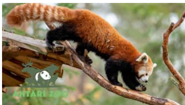
Pikkupanda on erittäin uhanalainen laji.

Pikkupanda on erittäin uhanalainen eläinlaji, ja eläintarhojen välisillä siirroilla turvataan pikkupandojen geneettisen perimän säilyminen. Luonnonvaraisen yksilöiden määrän arvioidaan olevan alle 10 000.