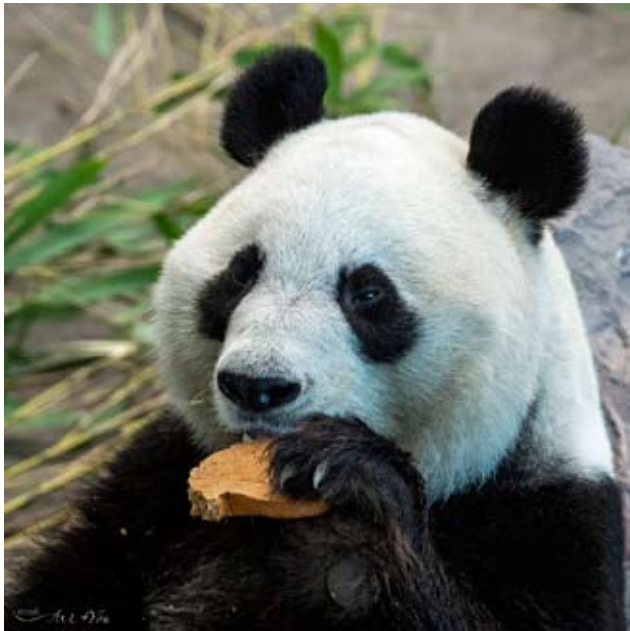
Lumin 8-vuotispäivä yhdistetään pikkupandojen omaan päivään eli ensi lauantaina vietetään tyttöpandojen päivää.

Ähtäri Zoon pandatytöillä on oma yhteinen päivä ensi lauantaina. Eläinpuistossa päätettiin yhdistää kaikkien pandatytöiden juhlinta samalle päivälle. 17.9 on virallisesti pikkupandojen päivä, mutta juhlat vain paranevat, kun lisätään siihen myös synttärisankari. Isopanda Lumi täyttää 8 vuotta. Lumin vuosipäivää juhlistetaan perinteisesti yllätyslajilla, jonka avaaminen on sekin lauantaina.