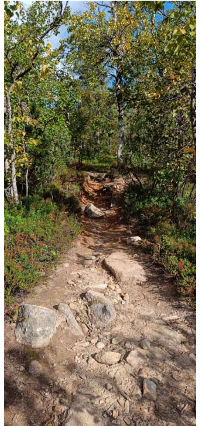
Alavuden seurakunta teki perinteisen ruskamatkan Enontekiölle 29.8-3.9. polku Keimiötunturille