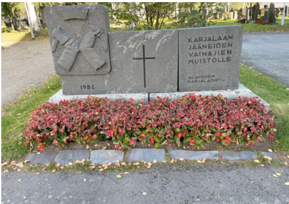
Lähellä kirkkoa on Alavuden Karjalaan jääneiden vainajien muistomerkki.

Karjalan Liiton valtakunnallinen talvisodan syttymisen muistotilaisuus pidetään Alavudella keskiviikkona 30.11.2022. Tilaisuus alkaa kello 15.00 Alavuden kirkkopihassa seppeleen laskulla Alavuden Karjalaan jääneiden vainajien muistomerkille ja Pyhä-Säätiön muistokiville. Kirkon portailta seppelpar-