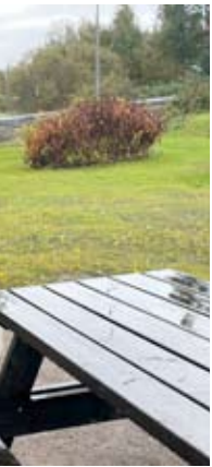
Uusi katseli uusia otko on laitettu ajapuiston kiin-