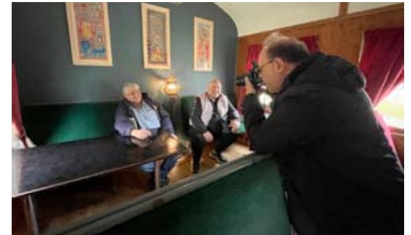
Junan yhteisten tilojen junanpenkkeihin istahdettiin toviksi ja tämä ikuistettiin kotiin viemisiksi niin Maltalle kuin Irlantiinkin. Junahotelli oli elämyksellinen käyntikohde itämaisine tunnelmineen.