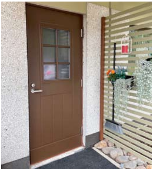
Pajutien kohteessa on myös ulko-ovet uusittu.