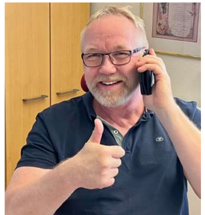
Ähtärin kaupunki toteuttaa syyskuun lopulla-lokakuun alussa puhelukampanjan alueen yrittäjille. Äänen robottipuheluille on antanut elinvoimakoordinaattori Pertti Nurmi.