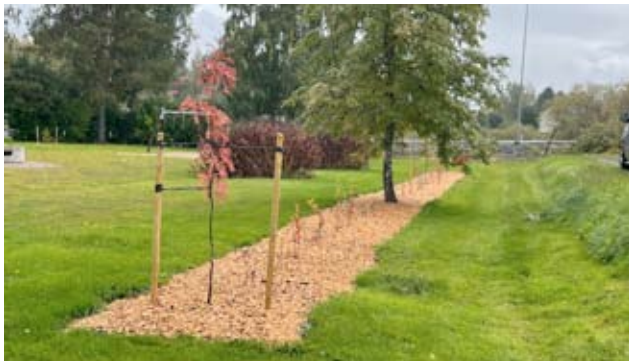
Alue on myös saanut uutta pensasaitaa ja kauniita istutuksia.