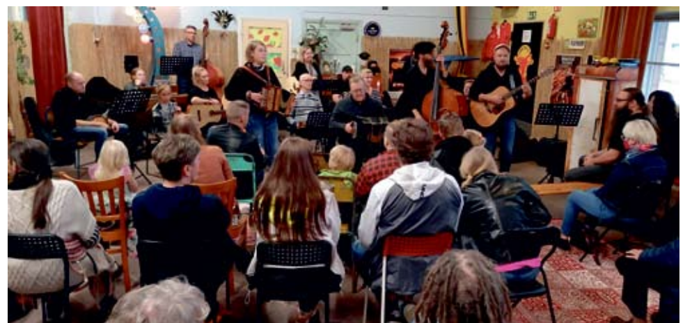
Kulttis Folk- musiikki-ilta Alavuden Monkey Islandissa

tiloissaan enemmän erilaisia tapahtumia. Seuraava tilaisuus, joka järjestetään Monkey Islandissa on Monkeys Comedy Club, jonka ajankohta on 30. syyskuuta. Terhi Sytelä