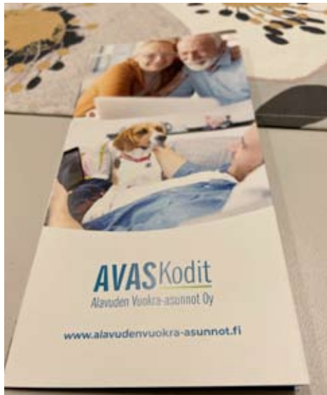
AVAS Kodit-nimellä saatiin pitkä nimi Alavuden Vuokra-asunnot Oy lyhyemmäksi ja jäämäkyyttä sekä uutta ilmettä logoon.