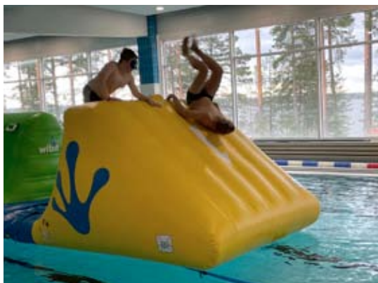
Temppuradassa oli melkoinen loppulasku veteen. Kuortaneella pidettiin uimahallikauden avaustapahtumana vesiliikuntarieha.

Myös vesijumput ja lasten uimatuokiot herättivät kiinnostusta. Vesijumpissa oli melko paljon väkeä.