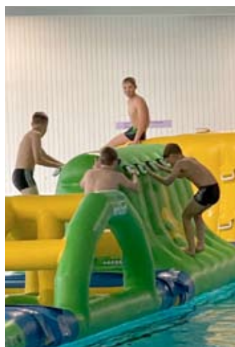
Vesiesteradalla osattiin temppuilla hyvin ja päivän aikana kyseltiin, onko rata vain yhden päivän uimahallissa.