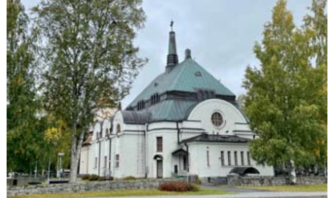
Seurakuntavaaleissa on Alavudella 6 valitsijajyhdistystä ja 57 ehdokasta.

Seurakuntavaalit pidetään sunnuntaina 20. marraskuuta. Vaalien ennakkäänestys alkaa tiistaina 8. marraskuuta ja ulottuu lauantaihin 12. marraskuuta.