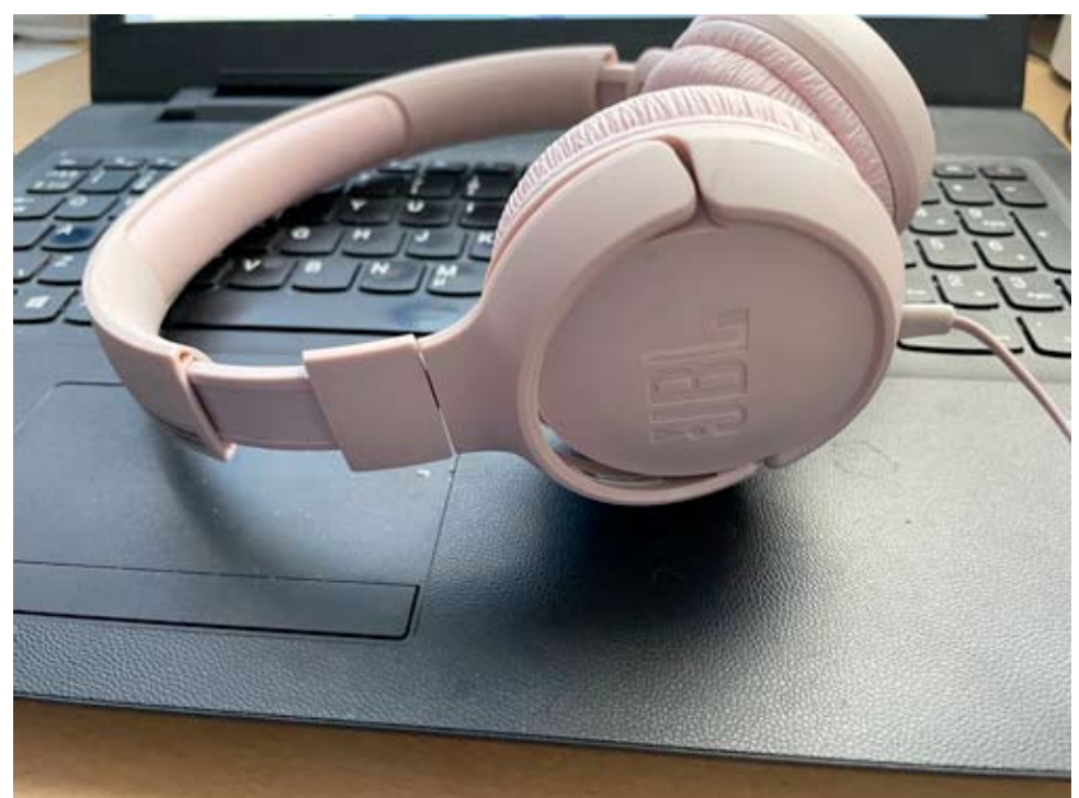
Ähtäri laittaa vauhtia valokuituun niin, että tavoitteena on jopa 100-prosenttinen verkkokattavuus.

Kuudesta ry järjestävalokuituinfon Ähtärin Myllymäen Kioski-kahvio Myllyssä torstaina 22.9. Ähtärin kaupungin ja Kuudesta ry:n yhteinen valokuituinfo, johon toivotaan kyliltä mahdollisimman laajaa osallistumista, järjestetään Pirkanlinnan auditoriossa tiistaina 11.10. klo 18.00.