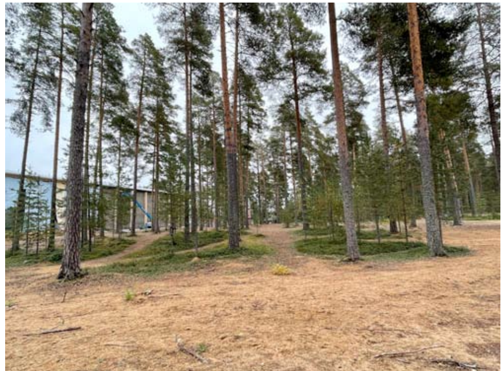
Uintikeskus on tulossa rakenteilla olevan monitoimihallin naapuriksi sen eteläpuolelle.

omistusta vastaavan summan 19.900 euroa lisääminen vuoden 2022 talousarvion investointiosaan. Lisäksi korostetaan sitä, että tonttivuokran muodollisuuden tulee tarkoittaa kunnan ja Urheiluopistosäätiön välillä vuoden 2022 aikana käytyjen neuvottelujen mukaista linjaa.