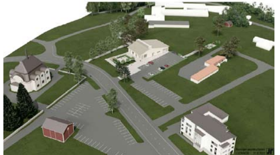
Tässä näkyy, miten tuleva Alavuden seurakuntatalo sijoittuu tontille. Kyse on vasta luonnospiirustuksista, jotka ovat Arkkitehti-toimisto Jorma Palorannan käsialaa.

Lähiainakoina seurakunnan sivuille on tulossa linkki videon Alavuden seurakuntatalon alustaviin luonnospiirustuksiin, jossa näkyvät myös suunnitellut sisätilat. Uudessa seurakuntatalossa olisi vaalea tiiliverhoilu. Nykyisen seurakuntatalon purkamisurakasta pyyde-