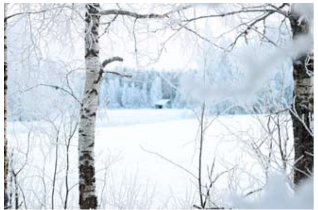
Kylät ovat tärkeitä, ja niiden hyväksi toimii ensi kesään kestävä Landemia. Moni löytää kylistä elämänsä asuinpaikan, jossa on niin avaruutta kuin talvista rauhaakin. Kyläyhteisöt ovat myös tärkeitä. Tämä talvikuva on Seinäjärveltä.

puolisoiesta ei löydy paikkakunnalta töitä.