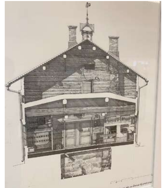
Tässä näkyy Ylisen tuvan poikkileikkaus.