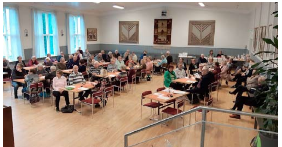
Eläkeliiton Töysän yhdistyksen syyskokouksessa oli Töysän nuorisoseuralla 78 henkeä