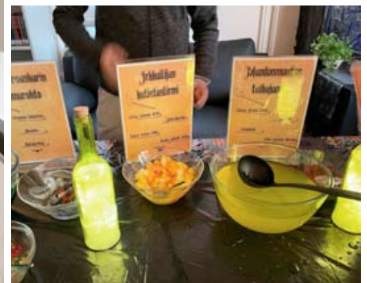
Tässä oli Taikajuomapajan aineksia, joista saattoi siemaista valmista juomaa tai tehdä sekoituksia, joissa oli karkkeja pohjalla.