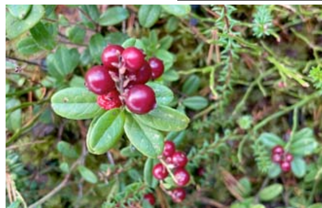
Ähtärin lähiruokapäivänä on marjatkin noukittu lähimetsistä kuten puolukkakeittoa varten.

- Joulun tienoolla on perinteinen jouluaateria ja tietenkin joulupuuroa. Pääsiäisen alla nautitaan pääsiäisateria ja vappuna on tarjolla munkkeja, Paavola kertoo.