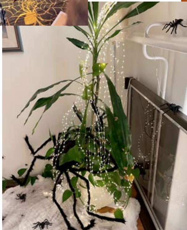
Koko Kuortaneen kirjasto oli valjastettu Potter-henkeen hämähäkkeineen ja oli nähty paljon vaivaa.