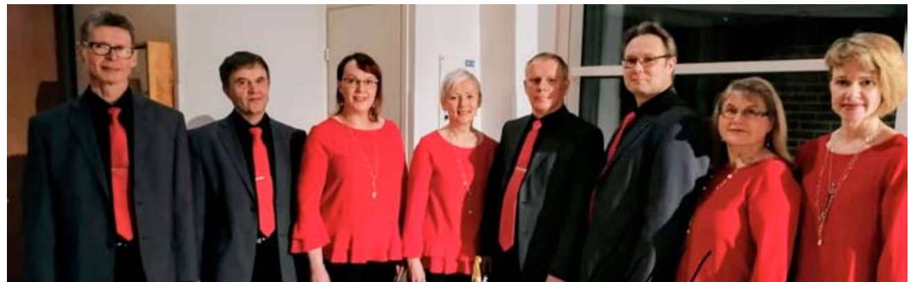
Lauluyhtye Amoroson käy 12-vuotisjuhlaconserttiinsa sunnuntaina 30. lokakuuta Alavuden lukion saliin. 10-vuotiskonsertti jäi väliin koronan vuoksi.

Väliajalla on kahvittelu, jonka tuotto menee Kirkkomännikön vanhempainyhdistyksen toimintaan. Lauluyhtye Amoroson 12-vuotiskonsertti järjestetään sunnuntaina 30.10.2022 kello 17.00 Alavuden lukion salissa.