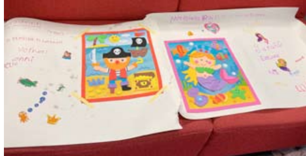
Merirosoleirillä ja merenneitoleirillä valmistettiin omat liput.

Leirillä oli aivan pienistä koululaisista viidesluokkalaisiin, joten ikähaitari oli melko suuri. Hauskaa leirillä oli, kun siellä oli monenmoista tekemistä.