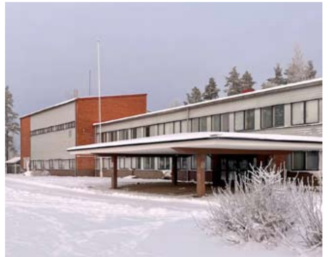
Tässä talvinen kuva Alvarin koulun pihapiiristä, josta tämä koulurakennus aikanaan puretaan.

Koska Alvarin koulun purkaminen on mennyt markkinaoikeudelle, vielä ei tiedetä, milloin entisen koulurakennuksen purkaminen olisi mahdollista.