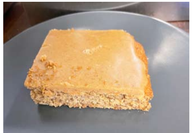
Herkullinen omena-kinuskipala oli uutuutena tarjottavana Töysä Innissä. Maku oli jo vähän jouluisen.