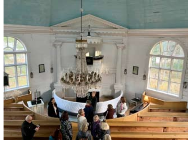
Kirkko on Engelin suunnittelema ja siinä on erikoisuus, että saarnapöytä on sillä paikalla, missä tavallisesti on alttari-taolu.

Gröhn kertoo, että tämä on Kansan Raamattuseuran paikka, jona se on ollut vuodesta 1976 lähtien ja nykyään Kansan Raamattuseura on yhteistyökumppani, sillä nykyään toimii Orisbergin kappelin kannatusyhdistys,