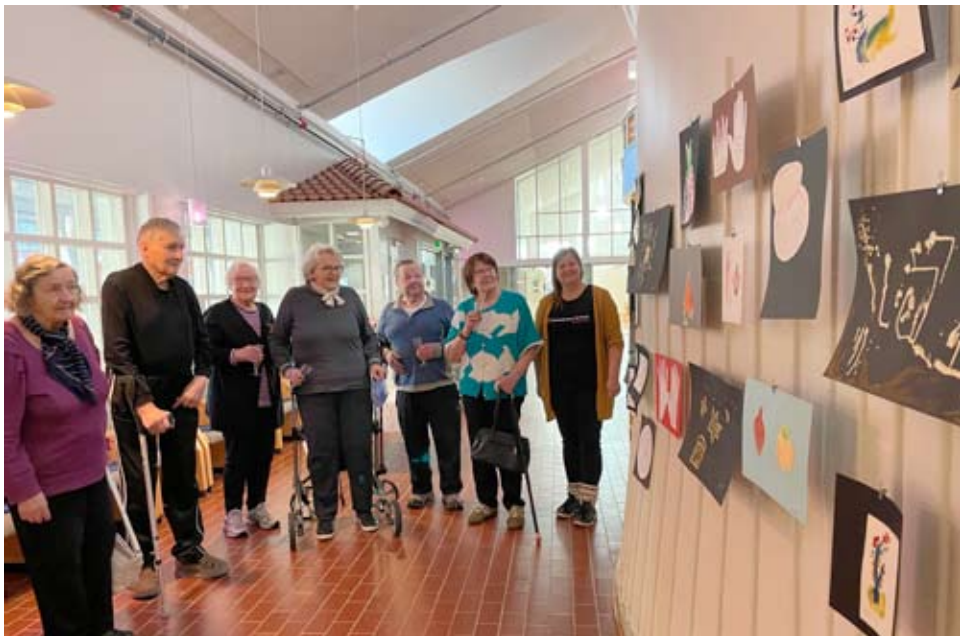
Kohtaamistaitteen ryhmä kokoontui viime viikon tiistaina viimeistä kertaa. Maljat nostettiin onnistuneiden kokoontumisten päätteeksi ja kahdeksan kerran kokoontumisista oli tötä laitettu Lukkarinhovin aulan seinälle.

- Mestari teoksia, kukahan nämä on oikein tehnyt! Näitä oli yksi aulan seinällinen Alavuden Lukkarinhovissa, jossa kahdeksatta ja viimeistä kertaa pidettiin Alavuden Ikätorin toimintana Kohtaamistaitteen ryhmää.