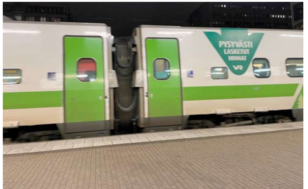
Alavuden kaupunki sai junaliikennekyselyyn 378 vastausta. Jatkoyhteydetkin ovat tärkeitä.

Yksiraiteinen rata ja vähäinen kalusto aiheuttavat haasteita, mutta kyselyssäkin ilmi tulleita asioita yritetään yhdessä kohentaa..