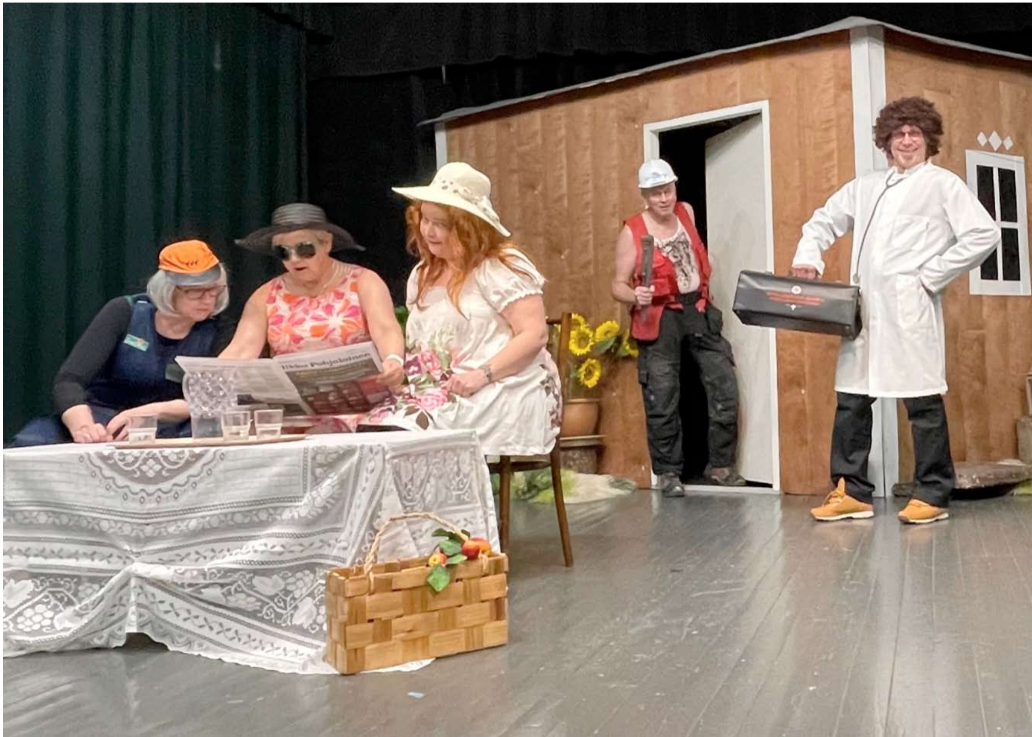
Melkoinen farssi syntyy kahden sisaruksen putkiremontista. Monenlaista sattuu tässä kahdeksan hengen esittämässä näytelmässä, jossa on niin putkimiestä kuin espanjalaista urologia.

Onneksi Töysän nuorisoseura on niin remontoitu, ettei siellä tarvitse tehdä putkiremppeä. Sellaista kuitenkin tarvitaan näytelmässä Kahden naisen putkiremppeä, joka valmistuu pikkujoulukauteen. Ensi-ilta on sunnuntaina 4. joulukuuta kello 15 ja vielä ennen joulua on neljä esitystä: maanantaina 5.12. kello 19 ja samaan kellonaikaan pääsee katsomaan näytelmää perjantaina 9.12. ja sunnuntaina 11.12. kello 15 ja kello 19. Näytelmät jatkuvat joulun jälkeen.