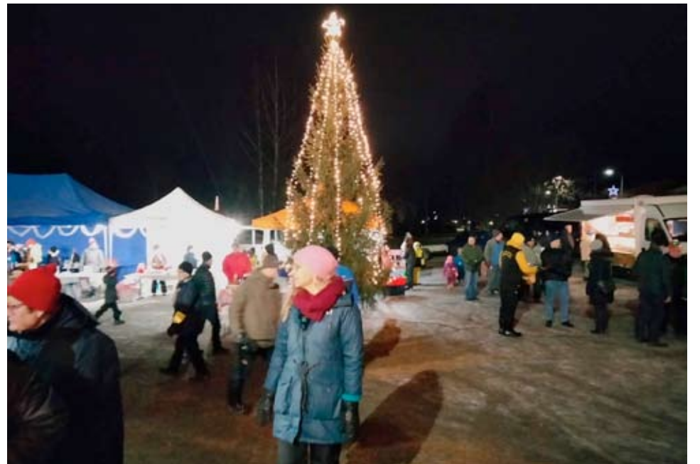
Paljon väkeä oli liikkeellä Kuortaneen joulunavauksessa, jota suosi pikkupakkanen. Markkinakojujen lomassa loisti iso joulukuusi.