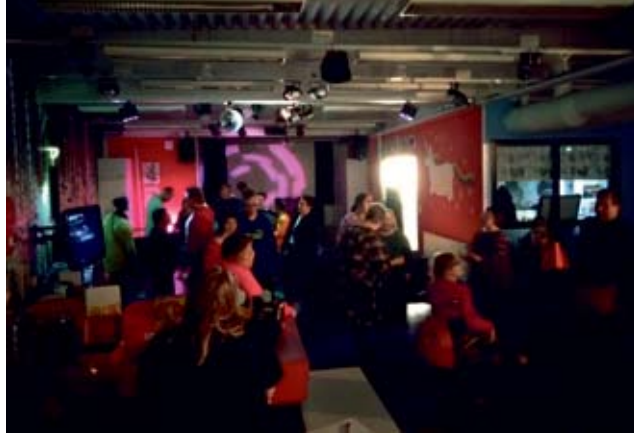
Nuorisotila Lymyssä järjestetty ensimmäinen erityisnuorten klubi-ilta hämyisine diskoineen onnistui erinomaisesti. Mukana oli kaikkiaan yhteensä 60 henkeä.

Ilta oli muutoinkin viihtyisää, ei vain tanssittu, vaan Ainin toiveen mukaan otettiin rennosti; pelattiin ilma-