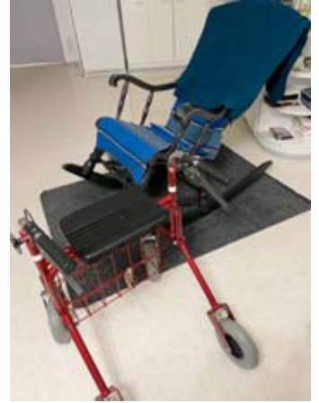
Etelä-Pohjanmaan hyvinvointialueella kolmen kärkeen ylsi Kuusiolinnassa Terveyden tuottaman Kuortaneen kotihoito.

Suomea. Lisätietoa löytyy THL:n verkkosivuilta.