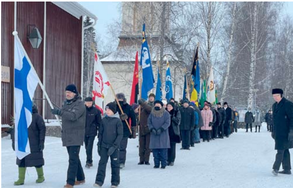
Alavudella on jälleen perinteinen itsenäisyyspäivän juhlakulkue kirkon pihamaalta sankarihautausmaalle. Tämä kuva on viime vuodelta.