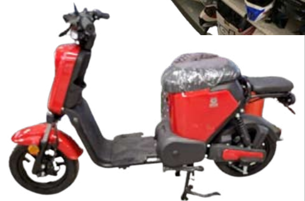
UUSI E-move 900€