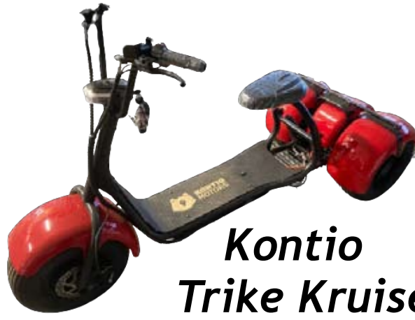
Kontio Trike Kruiser (UUSI, tehoakku) 1550€