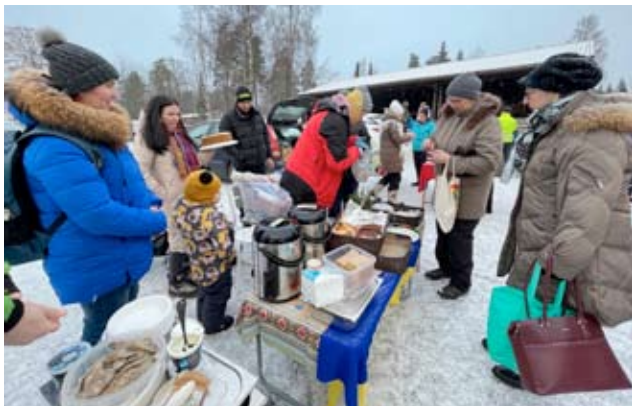
Ukrainalaisilla oli myynnissä monenlaisia leipomuksia, pullia, kakkuja ja piirakoita. Ne kävivät hyvin kauppansa.

Ähtärin kirkossa laulettiin ensimmäisenä adventtina Hoosiannaa ja sen jälkeen kirkon pihassa pidettiin ensimmäistä kertaa adventtimarkkinat. Kaupan oli monenmoista, ja seurakunta tarjosi kaikille lämpimät glögit ja piparit. Osa Ähtärin Mieskuorosta oli laulamassa tunnelmallisia jou-