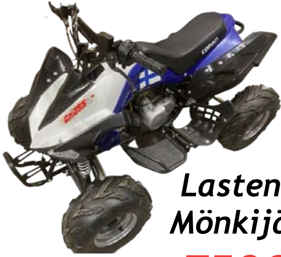
Lasten Mönkijä (uutta vastaava) 750€