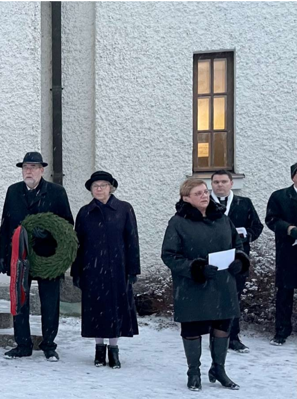
Alavuden kirkon rappusilta lähetettiin seppelpartiot Karjalan liiton valtakunnallisessa talvisodan syttymisen muistotilaisuudessa.