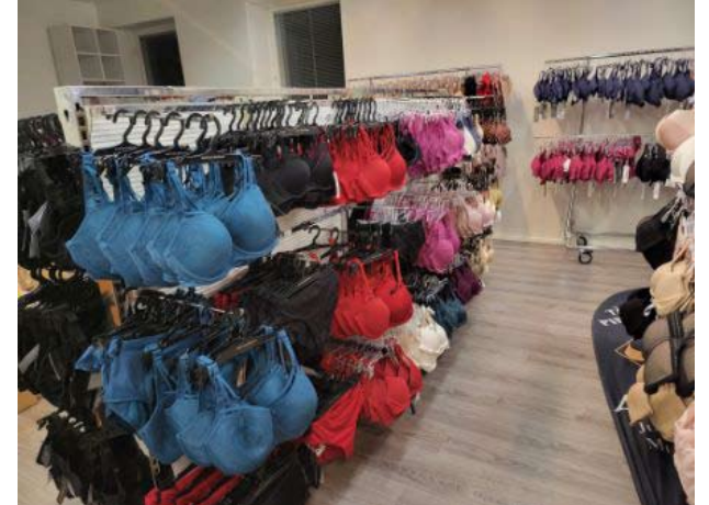
Rintaliiveistä on iso valikoima ja eri kuppikokoja löytyy. Näin joulun alla lahjakortit ovat suosittuja.

Valikoimaa hän kehuu laajaksi, ja kuppikokoja on