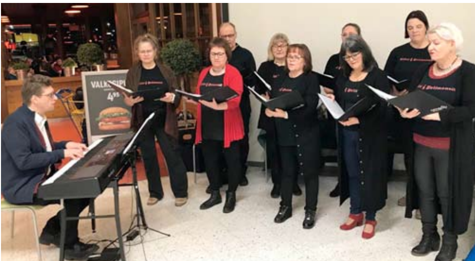
Monet tutut joululaulut tavoittivat asiakkaat Alavuden S-Marketissa, kun Tiilat ja Pelimannit esiintyivät.

Tiilat ja Pelimannit esiintyvät samassa paikassa Keskeisellä myös viime joulun alusaikaan.