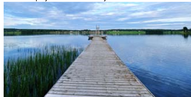
Alavuden kaupungille kehittämisspalkinnon toi Työhyvinvointiryhmä eli Tulevaisuudentekijät-ryhmä. Tässä järvi- maisemaa Alavudelta.

- Olemme erittäin iloisia, että henkilöstön työhyvinvoinnin kehittämistyömme on koettu merkittäväksi ja nousee näin palkitsemisen myötä esiin. Meillä Alavudella on paljon osaamista