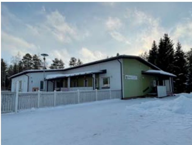
Tassulan päiväkotit aiotaan siirtää Kampinmäelle ja saa todennäköisesti jatkossa laajennuksen.