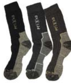
TYÖSUUKA PRIHA 3 PARIA