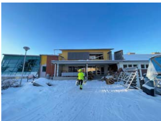
Korkein kohta Kunto-Lustrasta on uutena ylös rakennettu, noin 400 neliön suuruinen IV-konehuone, jossa on kuutioita vielä enemmän kuin neliöitä. Alavudella liikuntapaikat on keskitetty hienosti samalle alueelle.