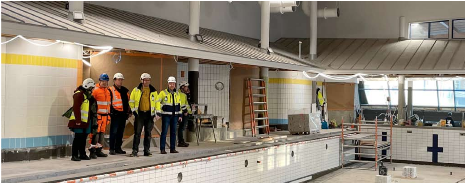
Osa rakentajista kokoontui altaan laidalle. Kunto-Lutra on aikataulussaan ja otetaan koulujen alkaessa käyttöön.

Kunto-Lutran peruskorjaus Alavudella valmistuu aikataulussaan kesällä ja uimaan pääsee elokuun alusta, suurin piirtein silloin, kun koulutkin aukenevat. Tiloissa kaikki sisäpinnat on uusittu, ja allasosasto näyttää entistä valoisemmalta, kun seinissä ja altaissa on vaaleaa kaakelia. Allashuoneen lasitiili-ikkuna on nyt tavallinen ikkuna, joka sekin tuo lisää valoa.