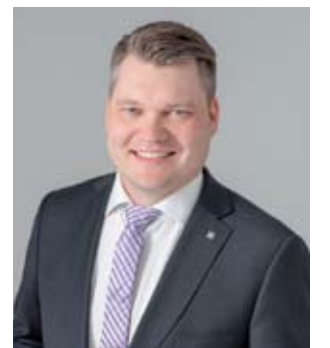
Puolustusministeri, kansanedustaja Mikko Savolan vaalistartti pidetään lauantaina 25. helmikuuta Töysän nuorisoseuralla. Silloin kuullaan ajankohtaisia asioita muun muassa Nato-prosessista ja sen etenemisestä.

Vaalistarttiin on varattu runsaasti aikaa vapaaseen keskusteluun ja kysymyksiin puolustusministerille. Mikko Savola myös kutsuu väkeä tukijoukkoihinsa.