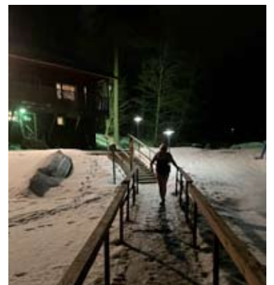
Ähtärin kaupunki omistaa kaksikerroksisen saunarakennuksen, jossa saunotaan kahdessa kerroksessa.

tiistaisin kello 17-20 ja torstaisin vähän vähemmän, kello 18-20.