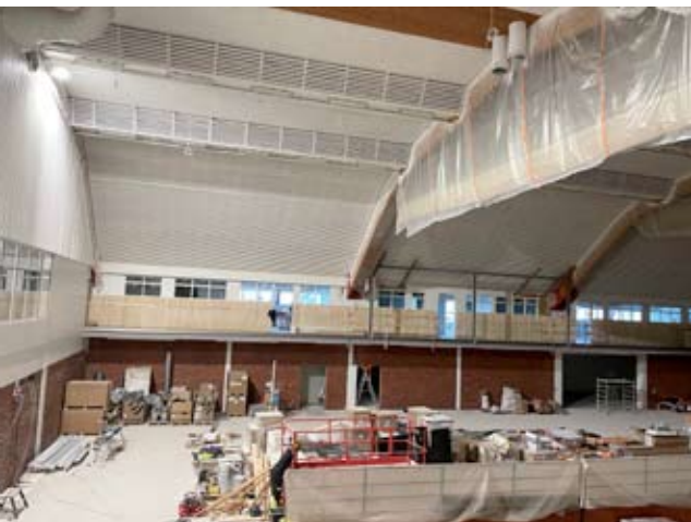
Liikuntasalin ritiläkatto on maalattu valkoiseksi. Toiselle puolelle salia ylös on rakennettu toimistohuoneet ja liikuntatila. Kaiteet ovat läpinäkyvät.