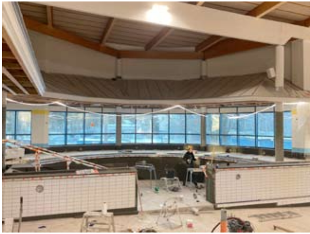
Koko rakennuksessa ahkerointi töissä. Altaiin tulee alashissit ja myös esteettömyys on otettu koko rakennuksessa huomioon.