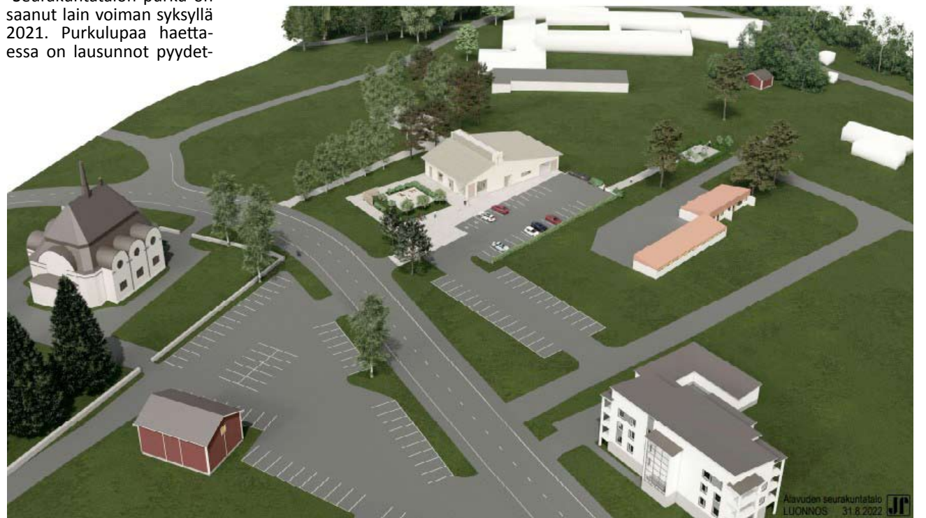
Tässä on havainnekuva, kuinka uusi seurakuntatalo sijoittuu.

Uuteen seurakuntataloon arkkitehti on tuonut piirteitä nykyisestä seurakuntatalosta: enkelisiipi-teema jatkuu salin ja pääsisäänkäynnin alakattomuodossa.