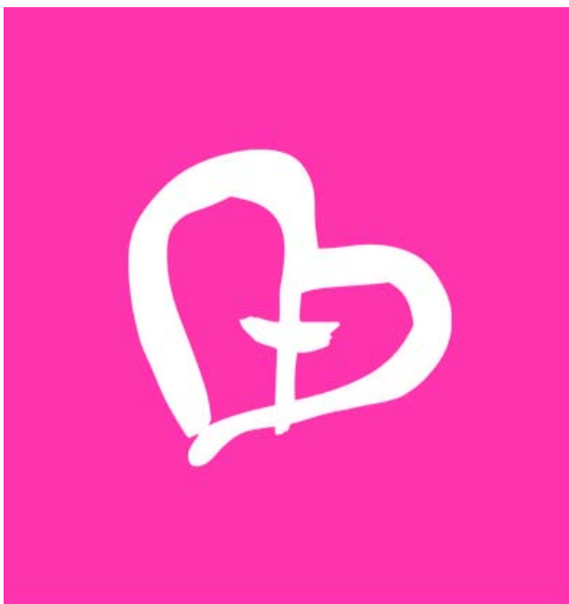
Yhteisvastuukeräyksen tummanpunainen tunnus on muuttunut pinkiksi.