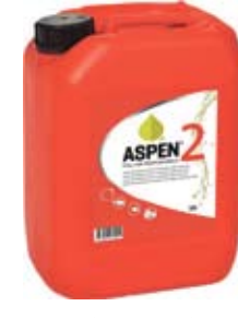
PIENKONEBENSINI ASPEN 2-TAHTI 10L