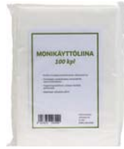
MONIKÄYTTÖLIINA 100 KPL/PKT