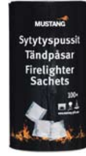
MUSTANG SYTYTYSPUSSI 100 KPL/PRK