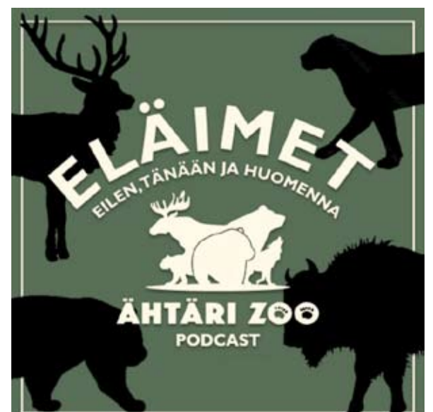
Podcast-sarjassa tutustutaan Ähtärin eläinpuiston kulissemiin.