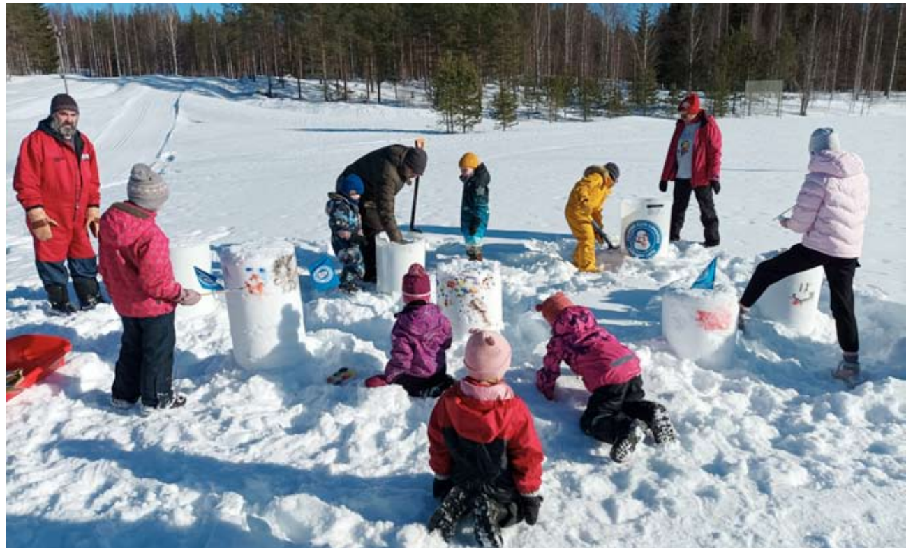
Koko perheen ulkoilutapahtuma koittaa tiistaina 28. helmikuuta Mustikkavuorella, jossa on muun muassa lumiukkojen tekemistä. Tätä oli viime talvilomallakin Suomenselän Samoillijoiden opastuksella.

Myös Ähtärin Eläinpuistola on monenlaista ohjelmaa talvilomaviikolle.